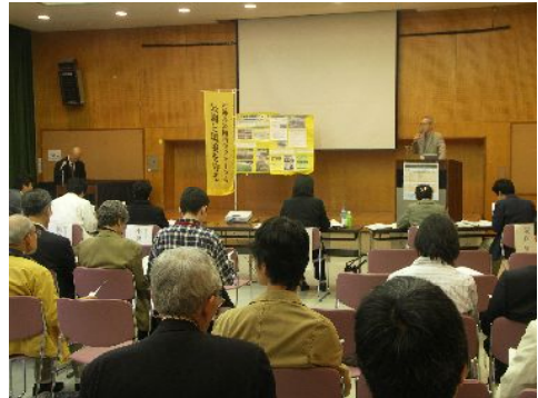
H20年度 活動助成事業 活動企画コンテストの一風景

まちづくりセンターの「まちづくり活動助成事業」は、区民が住み続けたいと思えるような美しい地域環境と豊かな地域社会の実現のために取り組む、区民主体のまちづくり活動への支援を目的とした事業で平成18年度よりおこなっています。平成18年度は11団体に100万円、平成19年度は15団体に総額230万円を助成しました。