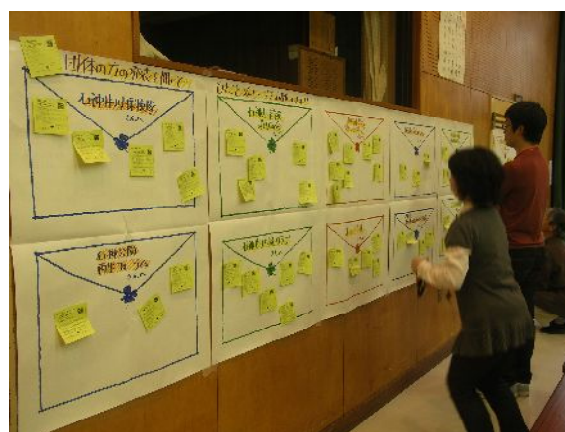
各団体に発表を聞いて感じたことを伝える メッセージボードを用意