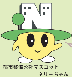
都市整備公社マスコット ネリーちゃん

同じ駅の駐輪場(屋根付き、平置き)を、1ヶ月定期利用したら、タ ウンサイクルと同じ2000円。4時間以内の当日利用も同じ100円。