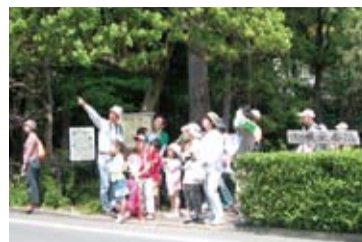
あの木の枝を見て!コソコソって音聞こえる?コゲラというキツツキの仲間だよ