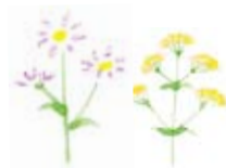
イラスト:やぐちゆみこ

5月9日には、『森となかよし』という行事をしました。お天気にも恵まれ、小学生10数人を含め40名のみなさんと自然体験を楽しみました。脱皮したばかりのハサミムシの真っ白な姿にびっくり!小さなイモムシを見つけて次々『触らせて!』の歓声などが羽沢の森にこだましていました。